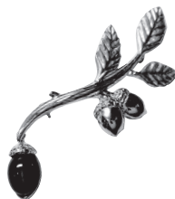
どんぐり：88,000 円 (シリマナイトキャッツアイ)