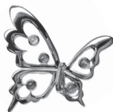
蝶 < 金 >：91,300 円 < 銀 >：88,000 円 (ファンシーカラーサファイア)