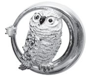
ふくろう：95,700 円 (クリソベリルキャッツアイ)

素材：シルバー 925 24 金メッキ 黒ロジウムメッキ (黒猫) アクリル合成樹脂 (ふくろう)