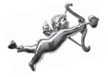
キューピット：72,600 円 (ルビー)