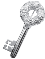
鍵：71,500 円 (ピンクサファイア)