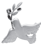
鳩：82,500 円 (グリーンサファイア)