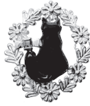
黒猫：70,400 円 (ルビー)