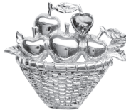
リンゴ：93,500 円 (ピンクトルマリン)