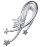
流れ星：110,000 円～ (女神のスターダイヤモンド)