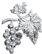
ぶどう：93,500 円 (アメシスト)