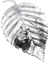
てんとう虫：99,000 円 てんとう虫のみ：61,600 円 (ルビー)

マダムイマダがお届けする幸福の扉を開く夢のアクセサリーは、ヴェルメイユという技法で製作しています。純銀に純金をかぶせたヴェルメイユはフランス王ルイ 14 世が祝祭の食卓に自分一人だけのヴェルメイユの食器、カトラリーを使用したと伝えられる特別高価なもので「金箔を着せた純銀」とも言われています。沢山の幸せが皆様の元へ訪れますように。