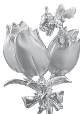
Blue Bee (青蜂)：150,000 円 (アクアマリン) (女神のスターダイヤモンド)