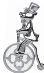
ぶた：104,500 円 (マザーオブパール)